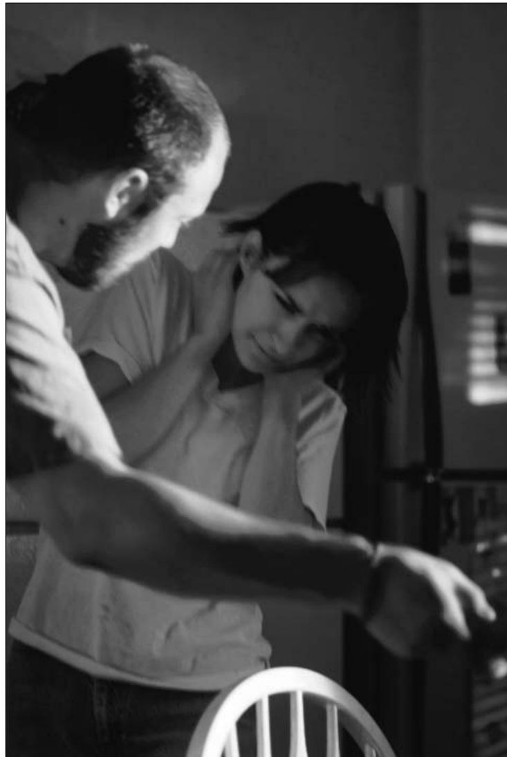
El hombre ha adoptado la violencia para hacer sentir su superioridad.

El agresor, dentro de la evidente posibilidad de una variada tipología personal, suele reunir unas